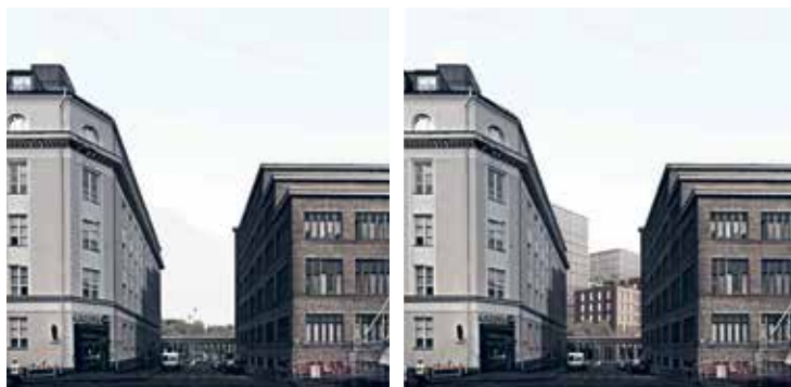
Havainnekuva muutoksesta Köydenpunojankadun katulinjasta tarkasteltuna. AOR Arkkitehdit, JKMM arkkitehdit. Helsingin kaupunki, kaupunkiympäristön toimiala.

Toisessa vaakakupissa painaa se tosiasia, että yhdessä Sadan markan villojen kanssa Marian sairaala-alueen eteläosa muodostaa säilyneine puutaloineen ja puustoineen mittakaavaltaan ja tunnelmaltaan yhden Helsingin parhaiten säilyneistä 1800-luvun ympäristökokonaisuuksista. Se ei kaipaakaan massiivista toimistotalokeskittymää vaan hienovaraista täydennysrakentamista, joka tukee olemassa olevaa, arvokasta rakennuskantaa ja puistomiljöötä.