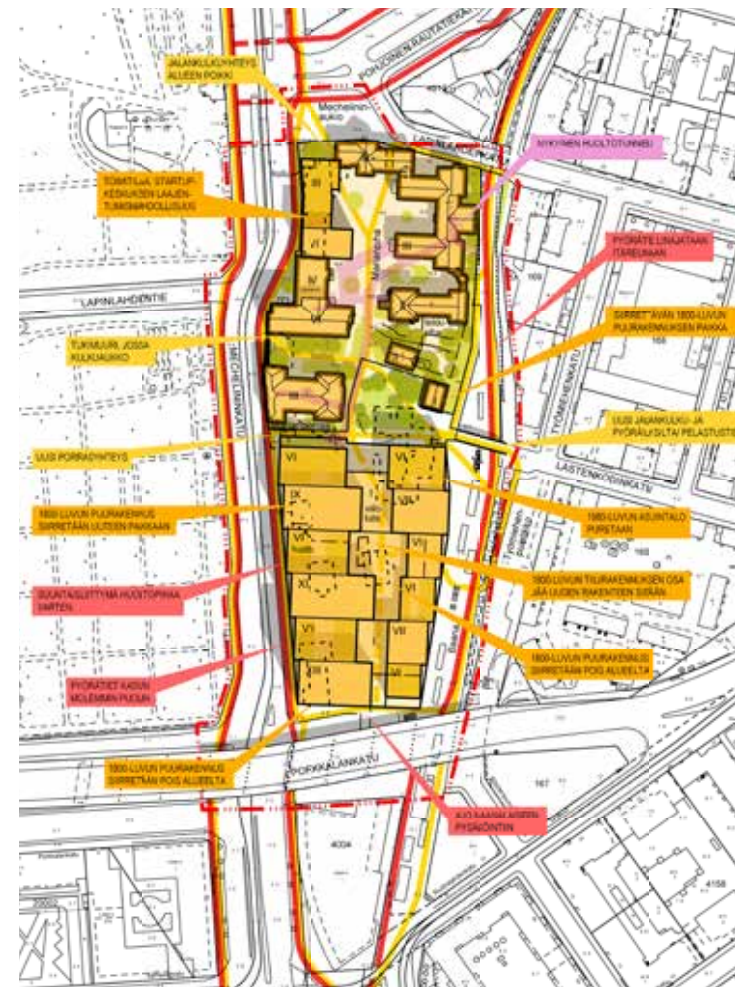
Vuoden 2019 asemapiirustuksessa näkyvät Marian alueen eteläosan keskeiset muutokset sekä uusien rakennusten paikat ja kerroskorkeudet. Helsingin kaupunki, kaupunkiympäristön toimiala.