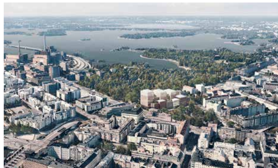
Havainnekuva osoittaa, miten radikaalia mittakaavan muutosta Marian sairaala-alueelle suunnitellaan. AOR Arkkitehdit, JKMM arkkitehdit. Helsingin kaupunki, kaupunkiympäristön toimiala.

Asemakaavan selostuksessa perustellaan, että ”muutos asettuu osaksi kantakaupungissa vuosikymmenten mittaan tapahtunutta kehitystä, jossa matalan puukaupungin tilalle rakentuu aiempaa tehokkaampi kivikaupunki”. Muutos, joka selostuksessa kytketään sata vuotta sitten Helsingissä tapahtuneeseen kehitykseen, tarkoittaa korkeimmillaan 13-kerroksista toimistotalorypystä, joka autohalleineen ja betonikansineen vahingoittaisi Marian alueen eteläosan lisäksi pysyvästi myös Lapinlahden ja Hieta-niemen valtakunnallisesti merkittävien rakennettujen kulttuuriympäristöjen